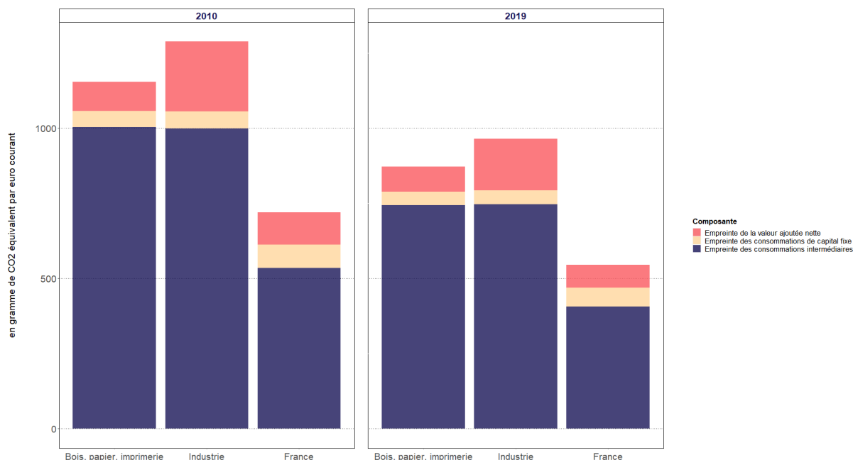
Graphique 1 : Compositions des empreintes de la production de la branche Bois, papier et imprimerie , de l’industrie et de toutes activités confondues en 2010 et 2019.

Données : Insee, Eurostat et Banque Mondiale. Traitement : La Société Nouvelle